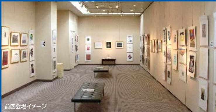
前回会場イメージ